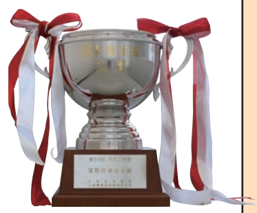
第39回日本農業賞大賞受賞