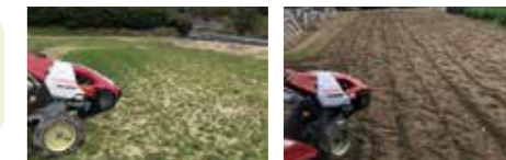
耕起前(イメージ) 耕起後(イメージ)

農機の操作方法は職員が説明します!空き状況で予約は前日でも可能です。予約当日が雨天の場合は、貸出日の延期もできます。興味をお持ちの方は、ぜひ一度産直支援課までお問合せください。