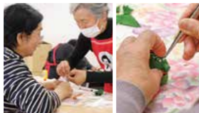
▲作り方を教わる参加者 ▲小さな竜の人形

参加者は「龍」のつまみ細工をスタッフと一緒に和気あいあいと作成し「細かい作業は指の運動になって良い」と話しました。