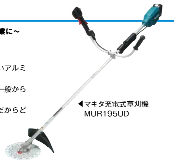
◀マキタ充電式草刈機 MUR195UD

★お問合せ 各営農事業所へ 西部営農事業所 TEL57-1886 本店営農事業所 TEL68-8216 大塚営農事業所 TEL59-8923 農機センター TEL68-6636