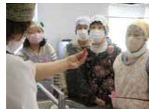
▲作り方を教わる参加者

職員は「Aコープかたはら、グリーンセンター蒲郡の産直品や共選品を購入して地元の農業をみんなで応援しましょう」と伝えました。