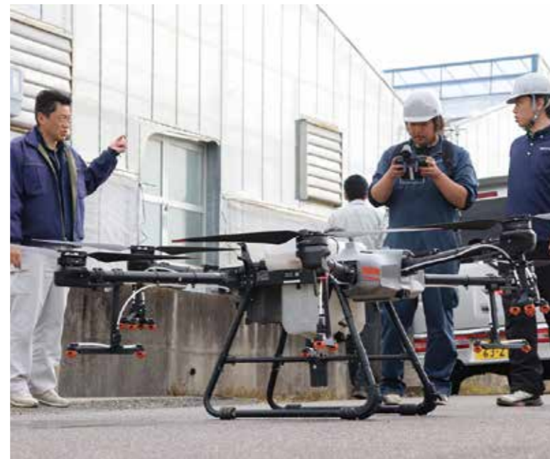
▲性能について確認をする職員